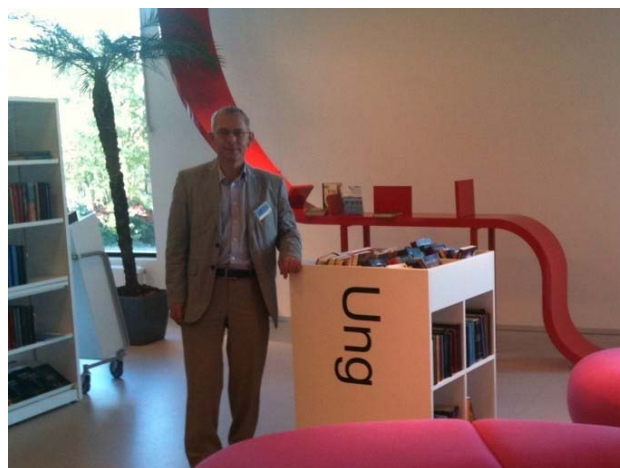
Jaak med den röda ribban.

Man hade lagt sig vinn om att involvera besökarna i verksamheten. Efter återlämning av böcker fick låntagarna själva ställa böckerna i ett tio