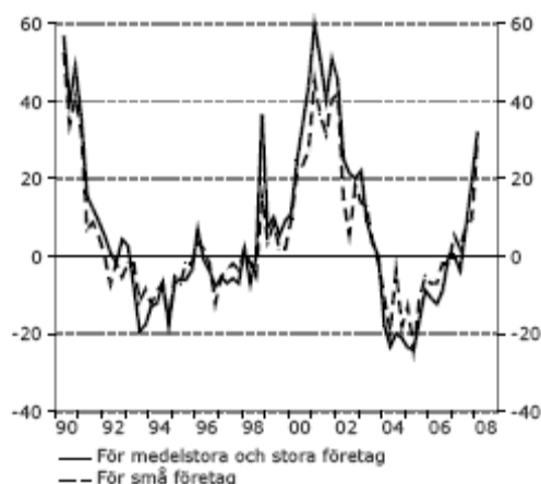
Diagram 64 Kreditundersökning, USA Andel banker som har stramat åt kreditvillkoren Procent, kvartalsvärden