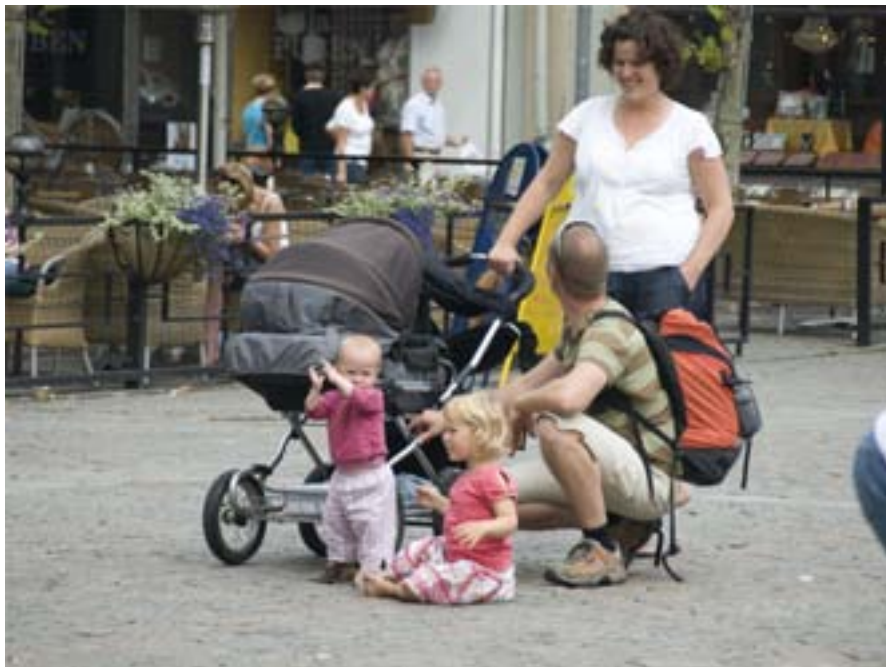
I Vänstermajoritetens Kalmar är barnfamiljerna förlorare, visar en undersökning från Hyresgästförening.